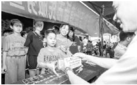
市民在活动现场参与垃圾分类活动。

启动仪式在顺德区隆重举行，多位领导出席并发表讲话，强调要深入挖掘顺德美食文化资源，创新传播方式，让顺德美食走向世界。