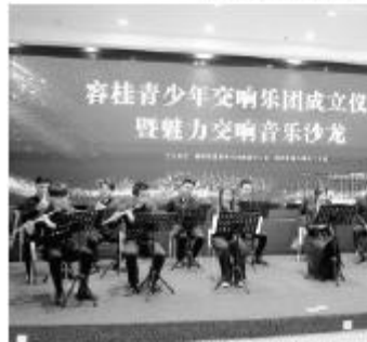
5日上午, 容桂青少年交响乐团成立仪式暨魅力交响音乐沙龙在碧桂园举行。

容桂青少年交响乐团, 旨在通过组建青少年交响乐团, 推动容桂各中小学音乐教育的发展, 提高青少年的音乐素养, 推动容桂各中小学音乐教育的发展。