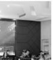
容桂青少年交响乐团成员合影。